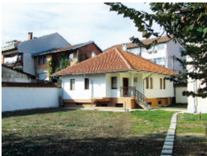
У четири зида црквене порте...