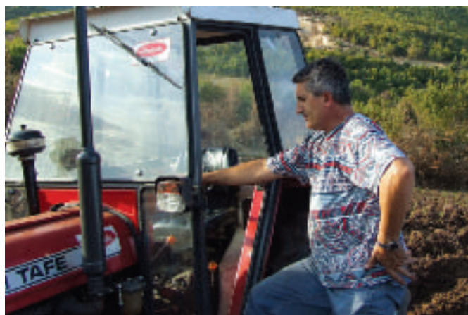
... а сћановници Синаја увелико у послу.