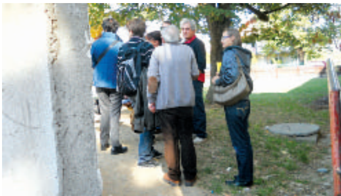
Сусрет са Италијанима у КЦ „Трмбас“