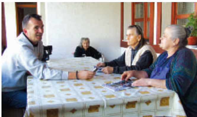
Репортер Уније са женама Ђаковице