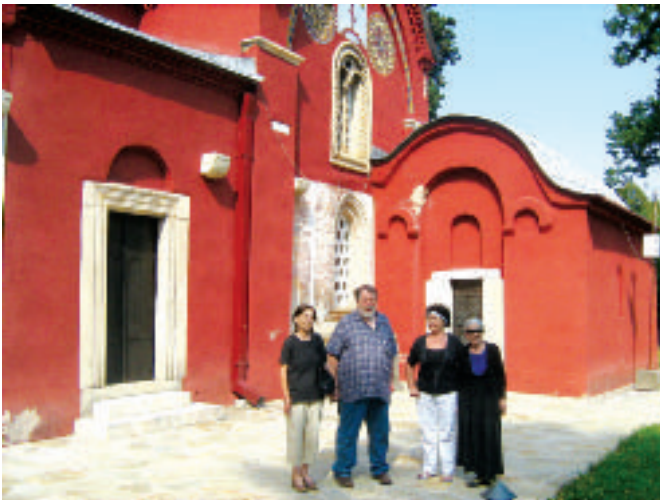
Аутор текста пред Пећком Патријаршијом

је других емоција било на претек. “Нисмо ми Авганстанци, па да спакујемо у платнене торбе своју имовину и одемо”, присетила сам се, док сам стајала под сводовима Високих Дечана, тако мала и ништавна пред монументалношћу овог манастира и задивљена његовом лепотом, речи једног Србина с Косова и Метохије који је, осамдесетих година прошлог века, са својим сународницима кренуо да остатку оне некадашње државе каже своју муку. И ја, којој су понекад падале на памет “богохулне” мисли да би, можда, подела Косова и Метохије могла бити некакво решење, као и он некада, запитала сам се: Како да оставимо своје светиње? И коме?