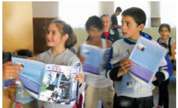
Најмлађи са Унија ИНФО

Господин из Косова Поља, који је сам, нема деце радо би да му се помогне при изградњи мале куће, јер у околини има свој плац од 6 ари, али с обзиром да је самац врло ће дуго морати да чека, јер критеријуми за помоћ фаворизују вишечлане породице.