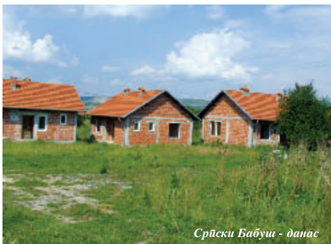
Српски Бабуш - данас

Воzeћи се магистралним путем од Урошевца према Приштини, након десетак километара скрећемо десно и после пар стотина метара стижемо у Српски Бабуш.