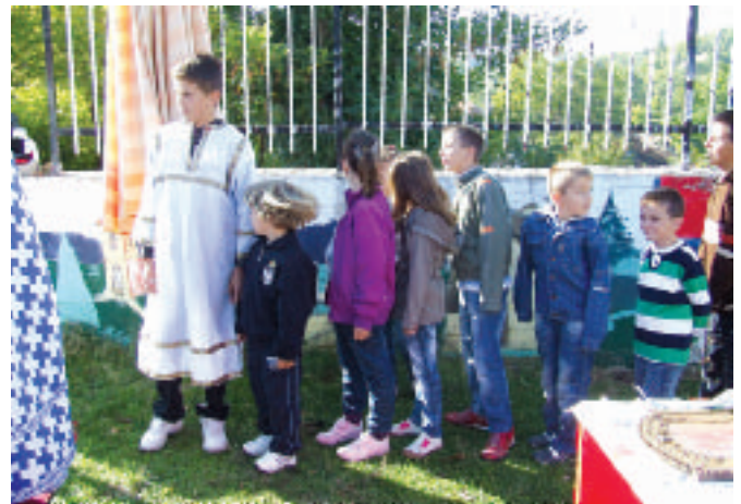
Најмлађи у реду за причешће

својих 13 цркава, од којих, најпознатија и најстарија “Свети Никола” датира још из 12-ог века, преостало је