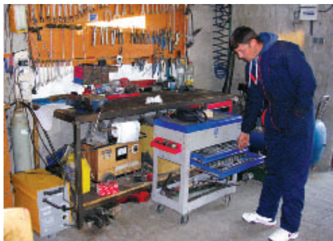
Алајћ постоји - недостјаје дијагностика

"Као отац двоје малолетне деце мора се мислити на будућност и константно улагати у усавршавање своје