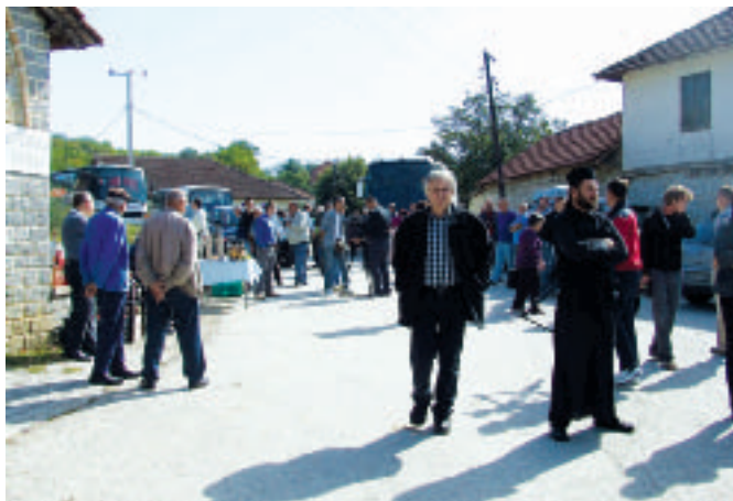
Хочански шрџ за разлику од ранијих манифестација, овај пут полупразан

У овом селу, сигурно најпознатијем на Косову и Метохији, по надалеко чувеном вину, а још више по