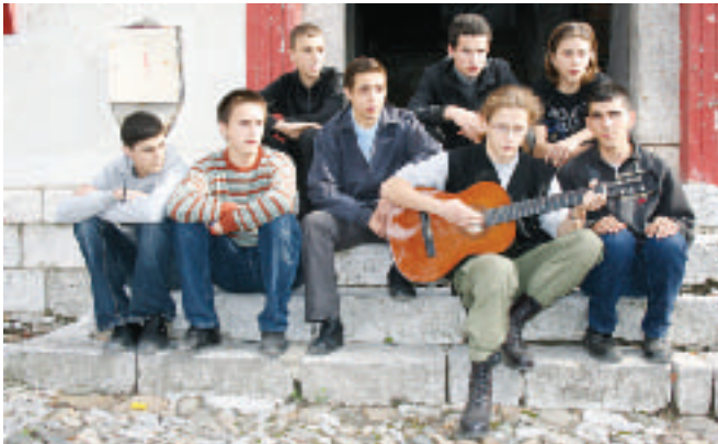
Прва генерација ученика Богословије након 12 година