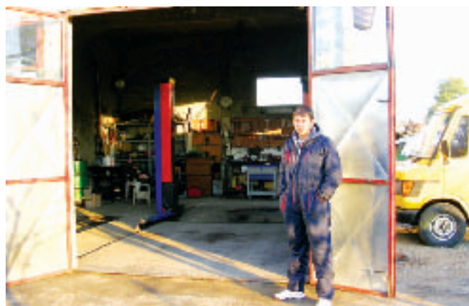
Радионица ошворена и за друже раднике