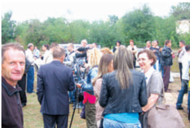
Дреновчани тек пристишли...