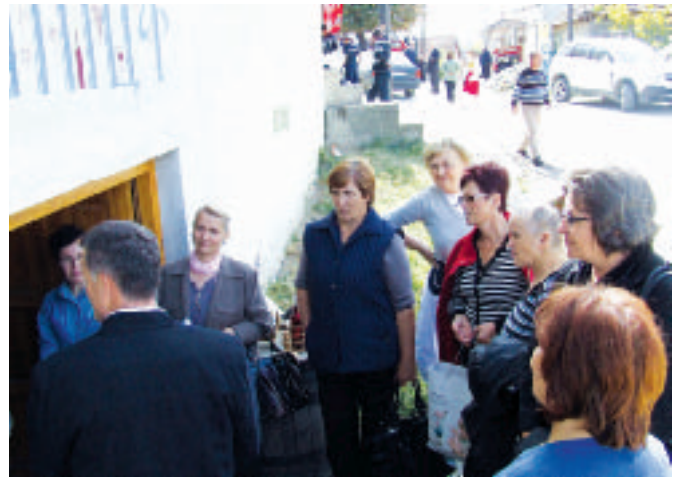
Васиљтачица из Липљана пред Виницом „Петровић“

Очекивао је да за Михољдан дође више људи, да се узме неки динар, али да његови производи оду на "дегустацију" широм Србије и КиМ. Тако би, сигуран је,