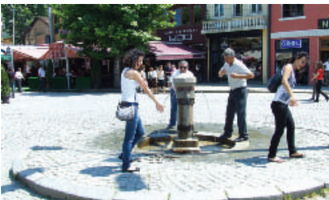
Освежење на Шадрванској чесми

Призрен, који ме је, једноставно, омађијао, чим сам га први пут видела 1997. године. Својом специфичном архитектуром. Својим каменим мостовима и Бистрицом. Архангелима и Богородицом Љевишком. И, наравно, гостољубивошћу наших тадашњих домаћина. И ја сам, као и песник, сва од успомена и туге. Од успомена, које навиру једна за другом. И од туге, зато што је